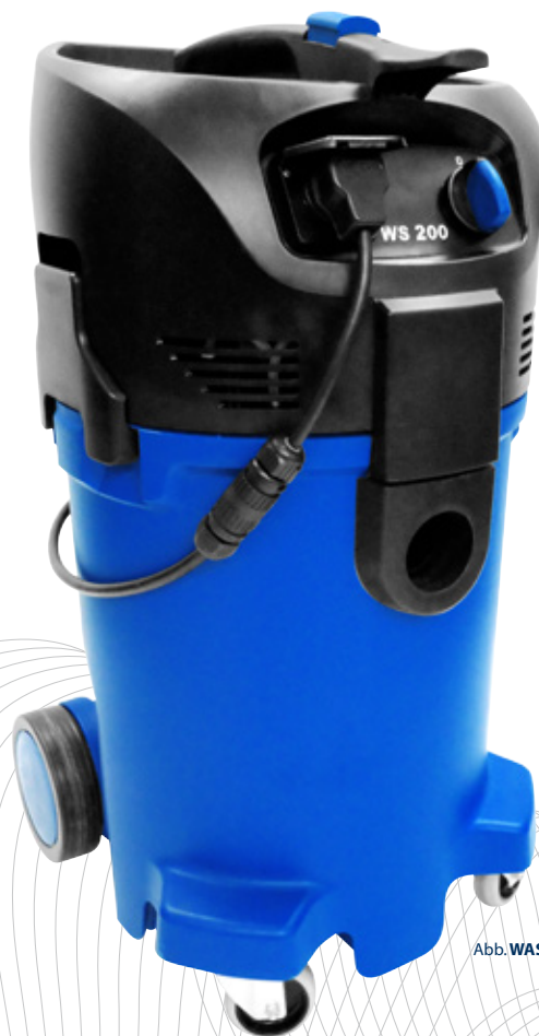
Abb. WASSERSAUGER WS 200